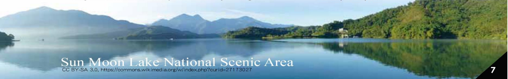
Sun Moon Lake National Scenic Area

Traditional Aboriginal Products TianLu, Pearl, Tea