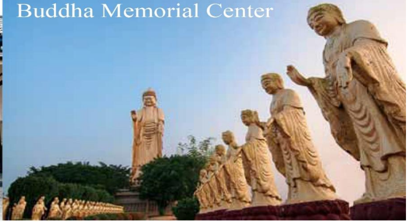
Buddha Memorial Center